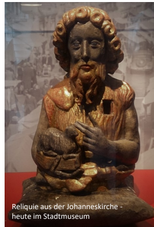
Reliquie aus der Johanneskirche - heute im Stadtmuseum

Dieser Streit wurde 1493 beigelegt durch den Künzelsauer Burgfrieden .