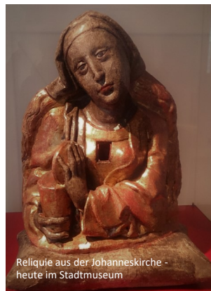
Reliquie aus der Johanneskirche - heute im Stadtmuseum

Der Johannesmarkt im Juni ist der älteste Markt Künzelsaus. Es gibt ihn auch heute noch.