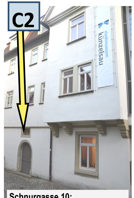
Schnurgasse 10: Das Stadtmuseum ist in einem renovierten Patrizierbau von 1614 im Jahre 2010 eröffnet worden. Besonders sind die angebauten Erker, die einen Blick in die Gassen ermöglichen.