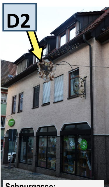
Schnurgasse: Dieses Schild gehörte zum Gasthof Adler, einer alten Schildwirtschaft. Künzelsau hatte früher über 20 Gaststätten.