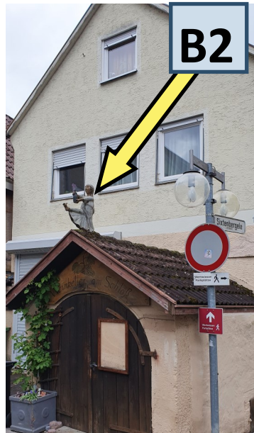
Schlossplatz– Einmündung Schlossgasse Hier befindet sich der Eingang zu einem alten Weinkeller. Das Dach ziert ein schlafwandelnder Weintrinker mit einer Weinflasche. Künzelsau war früher ein bedeutender Weinort.