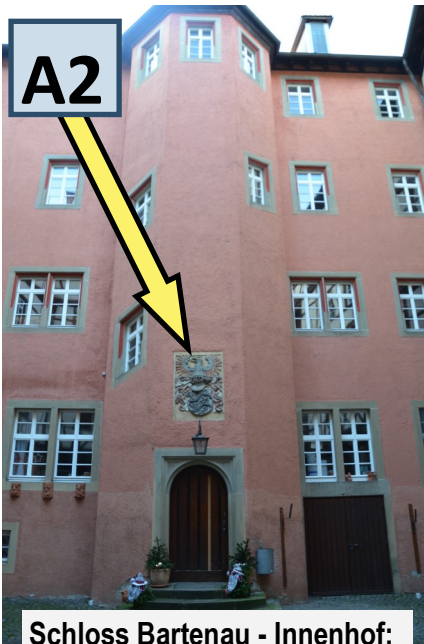
Schloss Bartenau - Innenhof: Diese Wappentafel über dem Eingang zum Turm mit der Wendeltreppe zeigt das Wappen der Hohenloher Fürsten.