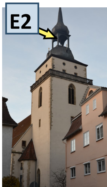
Johanneskirche: Den quadratischen, 47 m hohen Turm unserer Stadtkirche schmückt ein mit Schiefer gedeckter Zwiebelturm.